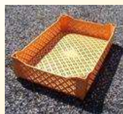
Cagette ajourées avec réhaut