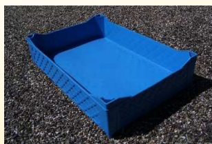
Cagette pleins avec réhaut

Réhaut : hauteur de 20 mm sur les quatre coins de la cagette