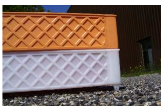
Cagette pleines sans réhaut

La gamme de produit avec même dimensionnel :